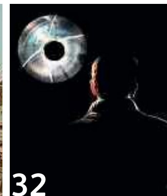
32 Selbst im Verhör können Lügner nicht immer entlarvt werden.