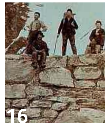
16 Naturgefahren: Wie gut schützen die Sperren im Lammbachgraben?