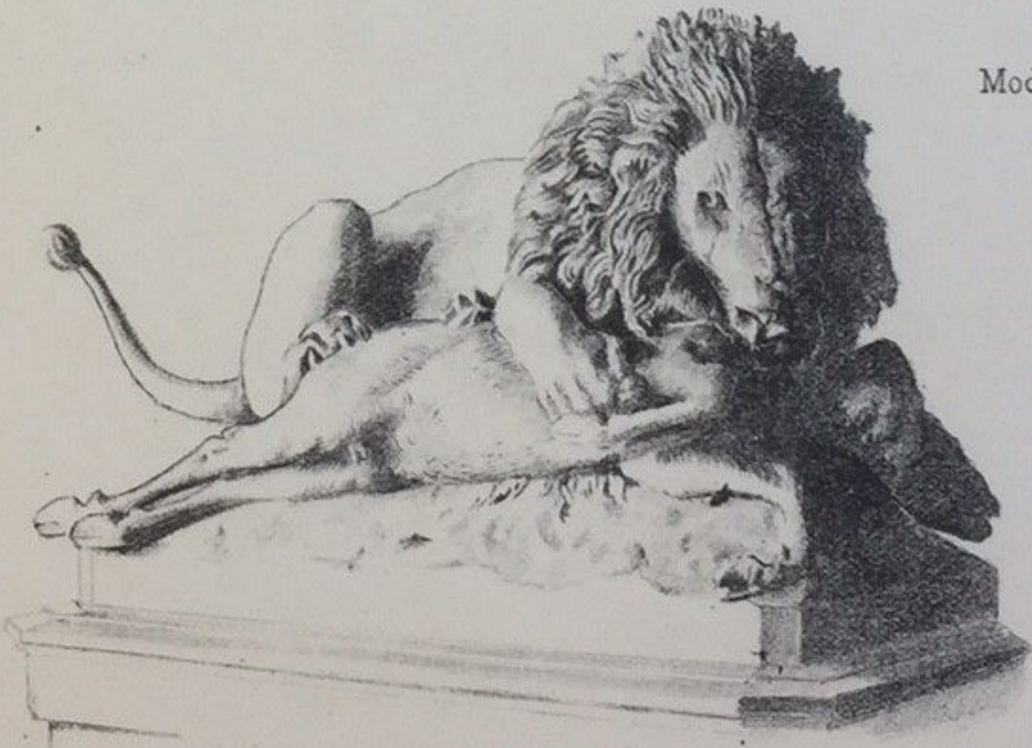
Modell zum Löwendenkmal von P. Eggerschwyl.