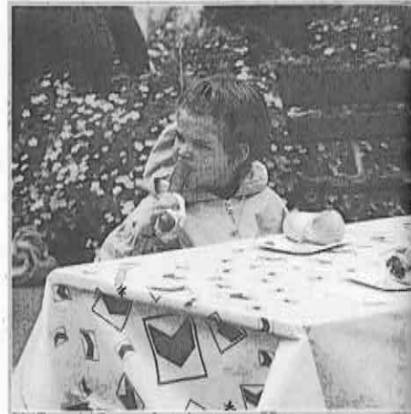
Doggwiler's feine Würste waren der absolute Renner...