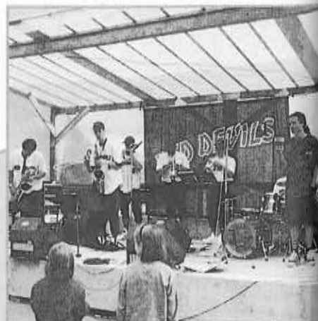
Musikalische Höhepunkte mit der Bourbon Street Jazz Band und den Red Devils