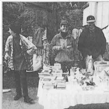
Am Flohmarkt sah man eifrige Kinder und gutgelaunte Quartierbewohner