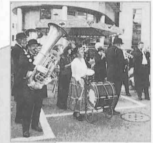
Taufständchen der Alten Garde der Notenheuer