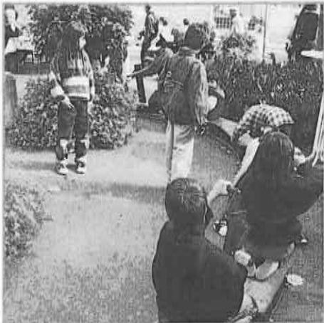
Ob Rösslspiel, Eisenbahn oder Malen: Die Kinder fanden's toll!