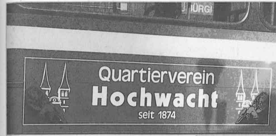
Juhui! Die Hochwacht hat ihren eigenen Bus!