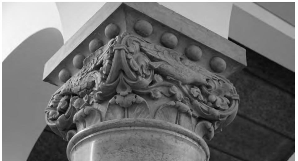
...und restaurierte Details des Altbaus.