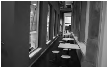
Sorgfältig renoviert: Neue Galerie...