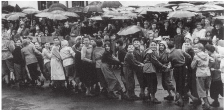
Am 24. März 1952 wurden die fünf Glocken in den neuen Turm der Maihofkirche hinaufgezogen – nach alter Tradition von Menschenhand, genauer gesagt von der «Schuljugend», die dafür gemäss Einladung «die obligatorische Wurst mit Brot» erhielt.