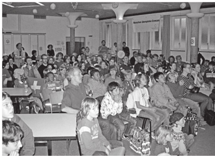
Begeisterte Zuschauer im Pfarreisaal Maihof

ff. Bei der Fussballweltmeisterschaft im Sommer hat nicht nur Spanien, sondern auch das Quartier rund um den Maihofturn gewonnen. Über 800 Fans wurden bei den Übertragungen im Maihofsaal gezählt. Sie kamen nicht nur wegen des Fussballs, sondern auch, um die kulinarischen Angebote der Quartierrestaurants zu geniessen und neue Leute kennen zu lernen. Ganz nach dem Motto der Veranstaltung «Gemeinsam feiern statt einsam glotzen».