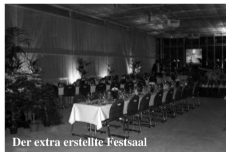
Der extra erstellte Festsaal

Die Zeit verging wie im Flug und um 19.00 Uhr versammelte sich die illustre Gesellschaft zum Nachtessen im wunderbaren, mit Stil und unübertrefflichem Ambiente liebevoll ausgestatteten Festsaal.