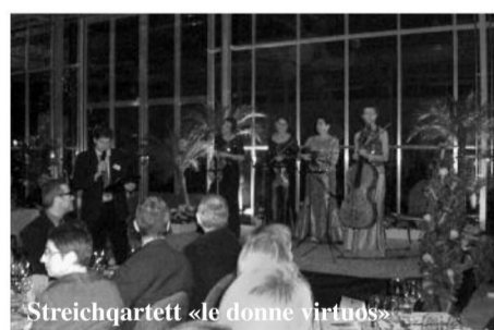
Streichquartett «le donne virtuos»

Nun folgte das absolute Highlight des Abends: das Feuerwerk war ein feenhafter Anblick und wurde von den Gästen mit frenetischem Beifall quittiert. Ein schöner Abend ging viel zu rasch zu Ende.