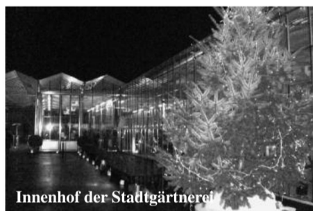
Innenhof der Stadtgärtnerei

Am Freitag, 10. Dezember 2010 fand die offizielle Eröffnungsfeier statt. Es war ein schöner kalter Winterabend, als die geladenen Gäste ab 17.30 Uhr zum Apéro mit Rundgang im Areal der Stadtgärtnerei eintrafen. Beachten Sie bitte die technischen Angaben am Ende des Artikels.