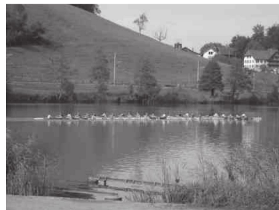
24er-Boot des «RCR» auf dem Rotsee

Die Speise- und Getränkekarte ist traditionell gut und international geschätzt.