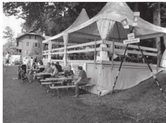
Das «Rotsee-Beizli» lädt zum Verweilen ein

Bereits zum 5. Mal in Folge wird dieses Jahr das «Rotsee-Beizli» an seinem bewährten Standort für Sie an folgenden Wochenenden offen sein: