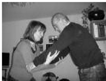
3. vom Sofa

Text und Fotos: Barbara Weber, Kinaesthetics-Trainerin, Luzern