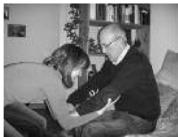
1. Unterstützung beim

Kinaesthetics wird heutzutage in fast allen Pflege- und Betreuungsberufen gelehrt und ist in vielen Alters- und Behindertenheimen ein nicht mehr wegzudenkendes Hilfsmittel.