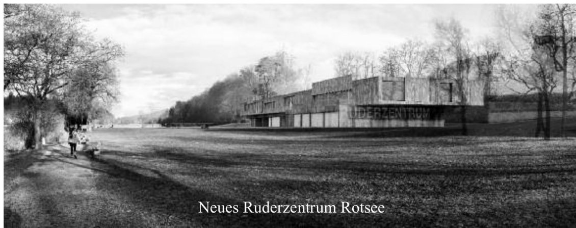
Neues Ruderzentrum Rotsee

In der Naturarena Rotsee sollen bis 2016 der Zielturm und das Ruderzentrum erneuert werden.