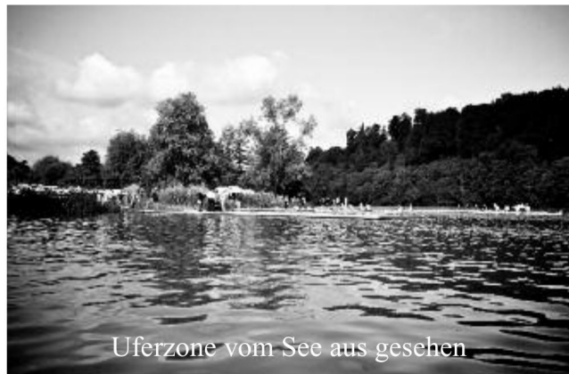
Uferzone vom See aus gesehen

Ferner ist vorgesehen, auch die Wege, Plätze und Uferzonen zwischen Rotseewiese und Zielgelände aufzuwerten.