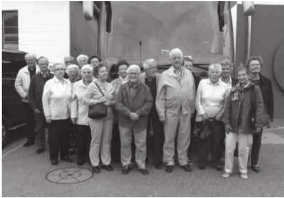
Reisegruppe QV. Maihof 2012

Es war ein heiterer Herbsttag, der Donnerstag, 4. Oktober 2012, als wir uns, die 18 Teilnehmer/innen inkl. Begleitung zum Jubilarenausflug vor der St. Josefskirche im Maihof trafen.