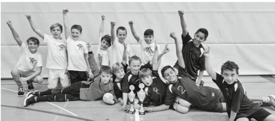
Kategorie 5. Klasse: Die Sieger (Klasse 5c) im blauen Dress, die Zweitplatzierten (Klasse 5a) in Weiss

Am Schüler-Handballturnier der Stadt Luzern vom 8. November in der Maihofhalle haben in der Kategorie 5. Klasse die beiden Mannschaften des Maihof-Schulhauses den Final unter sich ausgemacht. Gewonnen hat die von Herrn Wyss betreute Klasse 5c von Frau Appert. Den 2. Platz belegte das Team der Klasse 5a von Frau Hutter. Die Schüler der Klasse 6a von Herrn Wyss und Herrn Vogel gewannen das Turnier der 6. Klassen Knaben, die Knaben der Klasse 6b von Frau Nietlisbach waren auf Rang 5. Die Schülerinnen der Klasse 6b von Frau Nietlisbach platzierten sich im Turnier der Mädchen im Rang 4. Herzliche Gratulation!