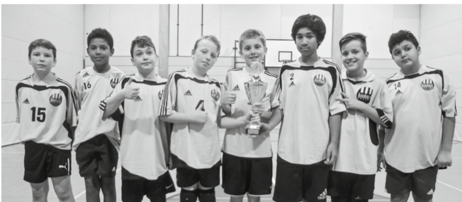
Kategorie 6. Klasse: die Sieger (Klasse 6a)