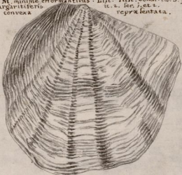
è parte convexa representata.

7 Berberis marina, seu Concha Mater Unionum dicta minor Jamaicana alà longiore et latiore, ac in extremitate Conchy angulum quasi acutum efformante, striata. Strius pluribus, et longè tenuioribus, apophysis vero cardinis interius quoque gracilioribus, et latissimam litem M. minimè efformantibus. List. Hist. Conch. lib. 3. part. 2. sect. j. de Pectinibus Margariferis. Pl. 2. Ser. j. et 1. representata.