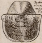
Pectinastrites, umbone cardinem au- ritum magnitudine longe excedente, per medium sulcatus et striatus. Stris tenuis- simis Norimbergensis. Merc. Met. p. 292.