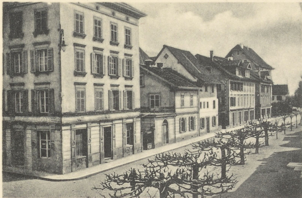
Zug: Oswaldgasse mit Kirche St. Oswald.