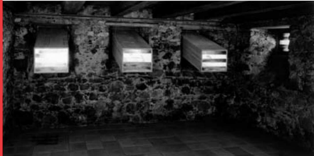
Die «Lichtklaus», eine eigens für das Museum Bruder Klaus entwickelte Installation von Jo Achermann, ist Teil der Ausstellung KÜR im Museum Bruder Klaus in Sachseln.

Das Museum Bruder Klaus eröffnet die Saison am Palmsonntag, 16. März 2008 um 11 Uhr. Zusätzlich zur Ausstellung über Leben, Wirken und Visionen des heiligen Niklaus von Flüe beherbergt das Museum eine umfangreiche Sonderausstellung.