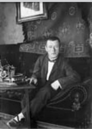
Der Dichter Heinrich Federer, Hauptfigur des Hörspiels «Er ist mir liebe wie der Abendstern».

Der Obwaldner Dichter Heinrich Federer (1866 – 1928) war in den 1920er- und 30er-Jahren einer der meist-gelesenen Schweizer Schriftsteller. Viele seiner Werke waren im ganzen deutschsprachigen Raum eigentliche «Bestseller». Mit dem Buch «Der Fall Federer» befasste sich Pirmin Meier, der im September diesen Jahres mit dem Innerschweizer Kulturpreis ausgezeichnet wird, mit einem Gerichtsfall, der in Federers Biographie gerne ausgelassen wird: Federer wurde 1902 der Verführung eines minderjährigen Knaben angeklagt.