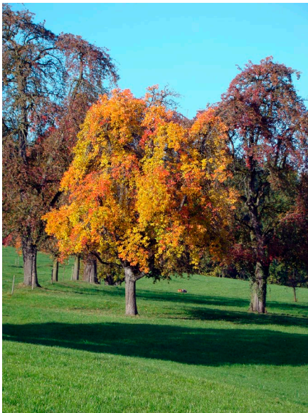
Hochstammobstgarten in Huwil