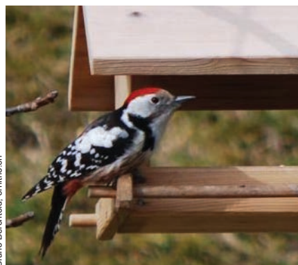
Dieser Mittelspecht besuchte im Winter 2008/09 regelmässig ein Futterbrett in Giswil OW und ist der erste Nachweis dieser Art für die Urschweiz.

Wann gelingt ein neuer Brutnachweis des Mittelspechts in der Zentralschweiz? Diese Frage hätte man sich bis vor rund 10 Jahren noch kaum zu stellen gewagt, deuteten doch alle Zeichen auf einen steten Rückgang hin. Nun ist die Art aber wieder auf Expansionskurs, die Ursachen dafür sind nicht klar. Diese Ausbreitung bestätigt sich auch bei den Aufnahmen für den Schweizer Brutvogelatlas 2013–16 der Vogelwarte Sempach. 1993–96 wurde der Mittelspecht erst in 59 Atlasquadranten (Quadrate mit 10 km Seitenlänge) nachgewiesen. 2013–15 liegen Beobachtungen dagegen schon in 122 Atlasquadranten vor!