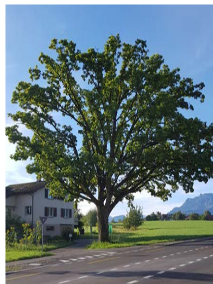
Von allen heimischen Baumarten leben in und an der Eiche die meisten Insektenarten. Daher widmet ihr der NAROS die 30-Jahr-Jubiläumsaktion.